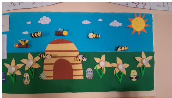
Svjetski dan pčela – 20.5